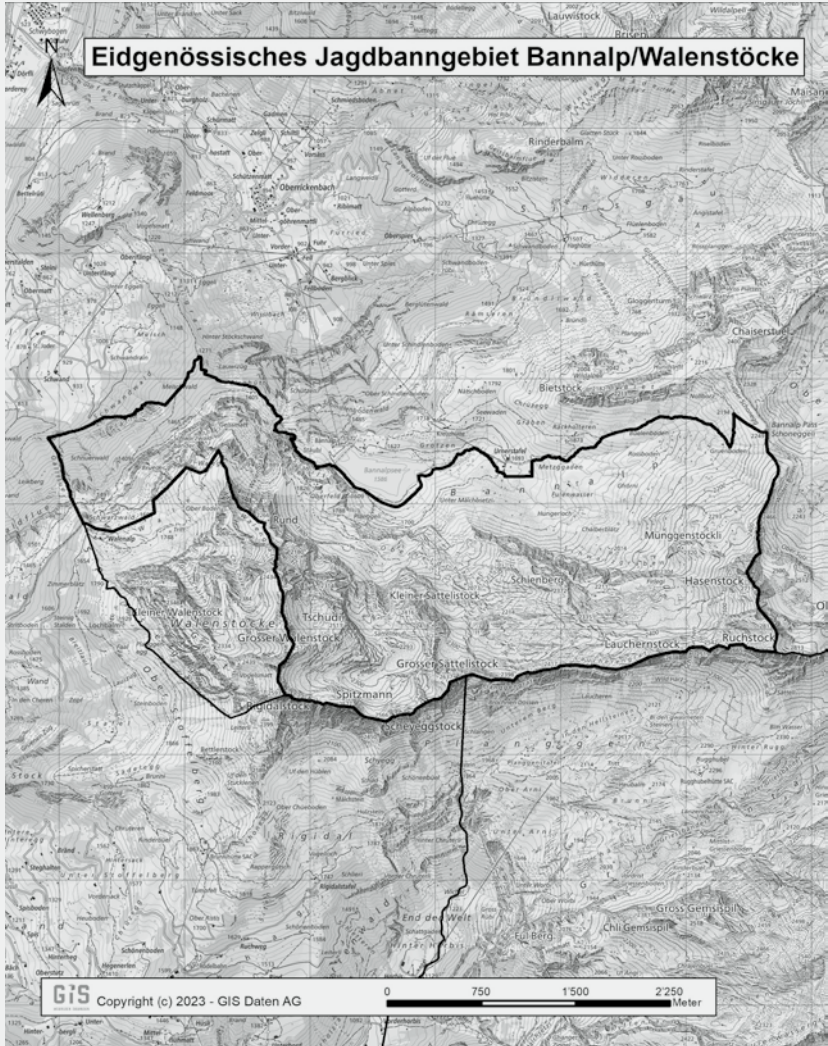
2 Eidgenössisches Jagdbanngebiet Huetstock