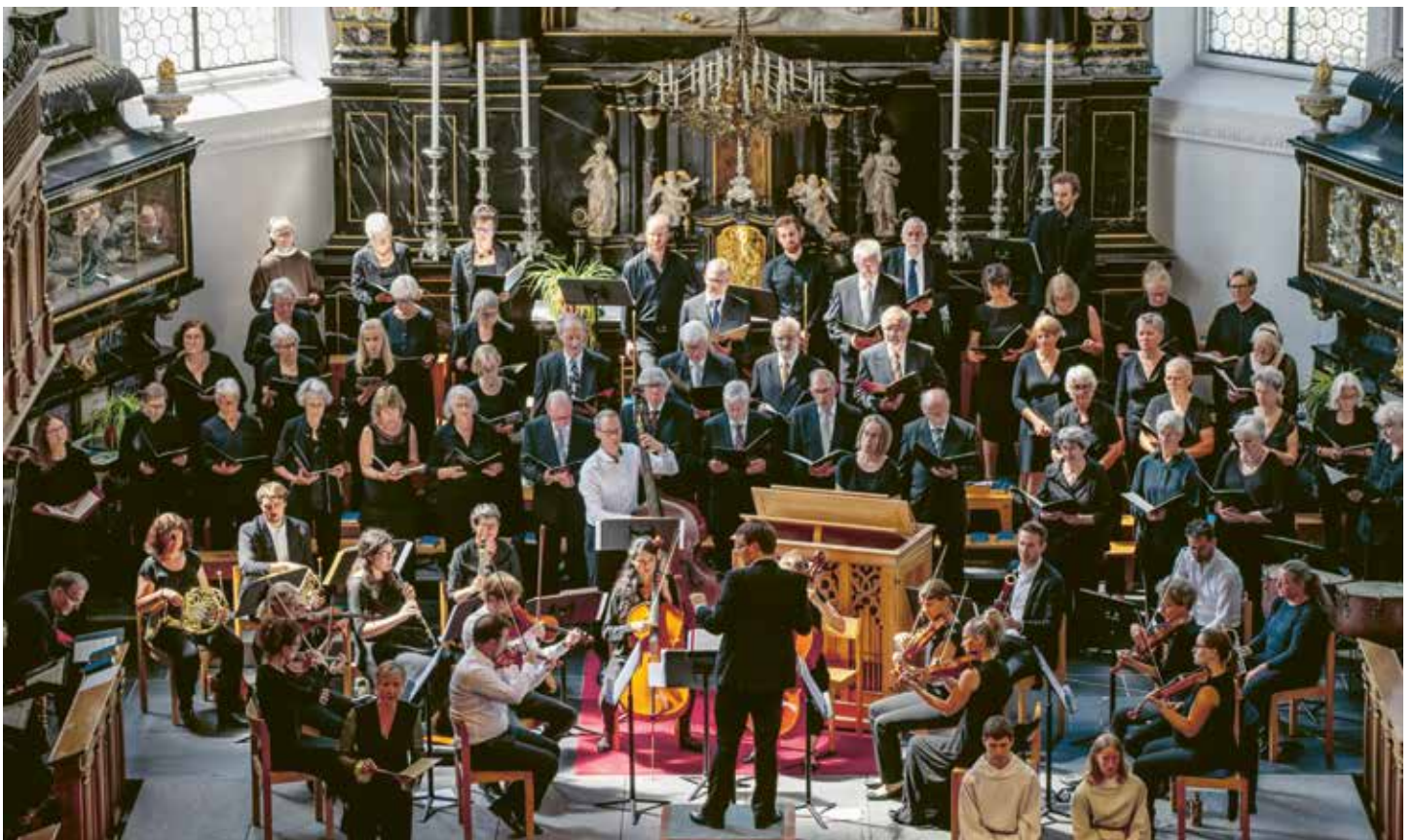
26. Juni 2022: Krönungsmesse mit dem Gemischten Chor Stans sowie Zuzügerinnen und Zuzüger.

Wird es gelingen, die bestehenden Chöre zu erhalten, oder werden eher parallel dazu wie in Oberrickenbach neue Formationen entstehen? In Nidwalden existiert ein Pool an sehr versierten Chorsängerinnen und -sängern, die am liebsten projektweise mitsingen, wo sie das Programm anspricht. Sie helfen vielen Chören, wieder ein-