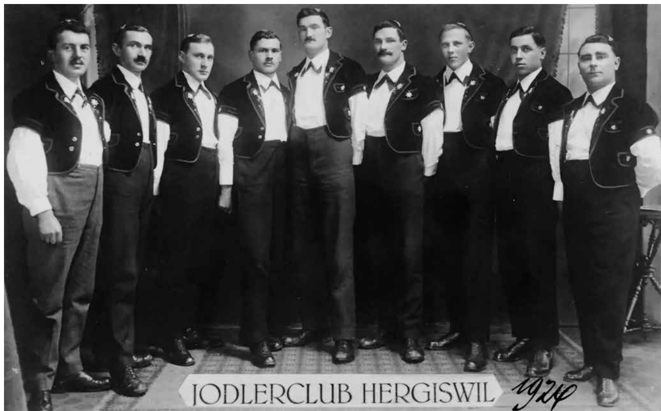
Der Jodlerklub «Echo vom Pilatus» drei Jahre nach seiner Gründung 1921.