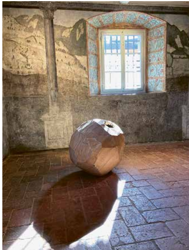
Ausstellungsansicht.