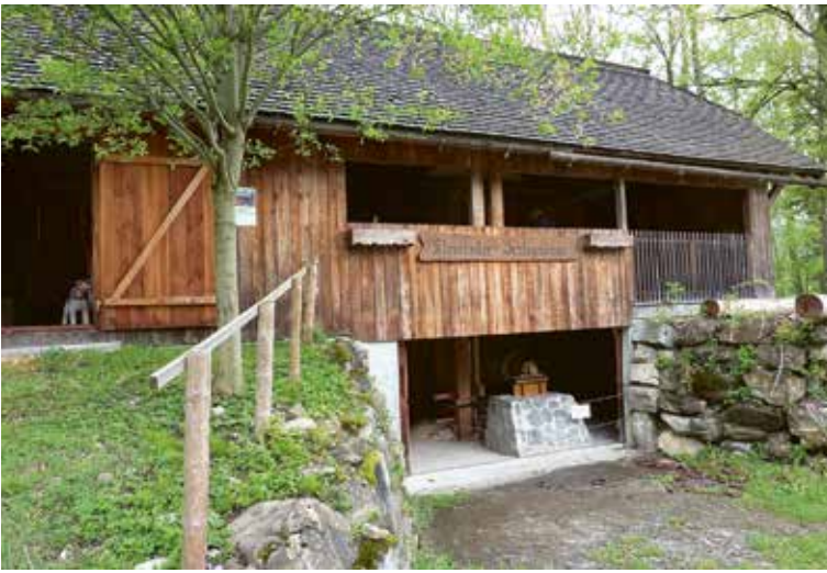
Restaurierte Schlegelsäge aus dem 18. Jahrhundert im Kleinteil Giswil.

Bücher und Hefte publiziert, sieben ständige Arbeitsgruppen gebildet, diverse Veranstaltungen organisiert, eine Website inklusive digitalem Museum und Mediathek online gestellt und mit der Kleinteiler Schlegelsäge ein einmaliges Bauwerk wieder instand gesetzt worden. Die Heimatkundliche Vereinigung Giswil wird von Ludwig Degelo präsiert und umfasst über 200 Mitglieder. Viele davon engagieren sich ehrenamtlich im Rahmen von Projektarbeiten. Sie betreiben einen erheblichen zeitlichen Aufwand, um historische Gegenstände zu sammeln, Schrftdokumente zu transkribieren oder vereinseigene Einrichtungen zu betreuen.