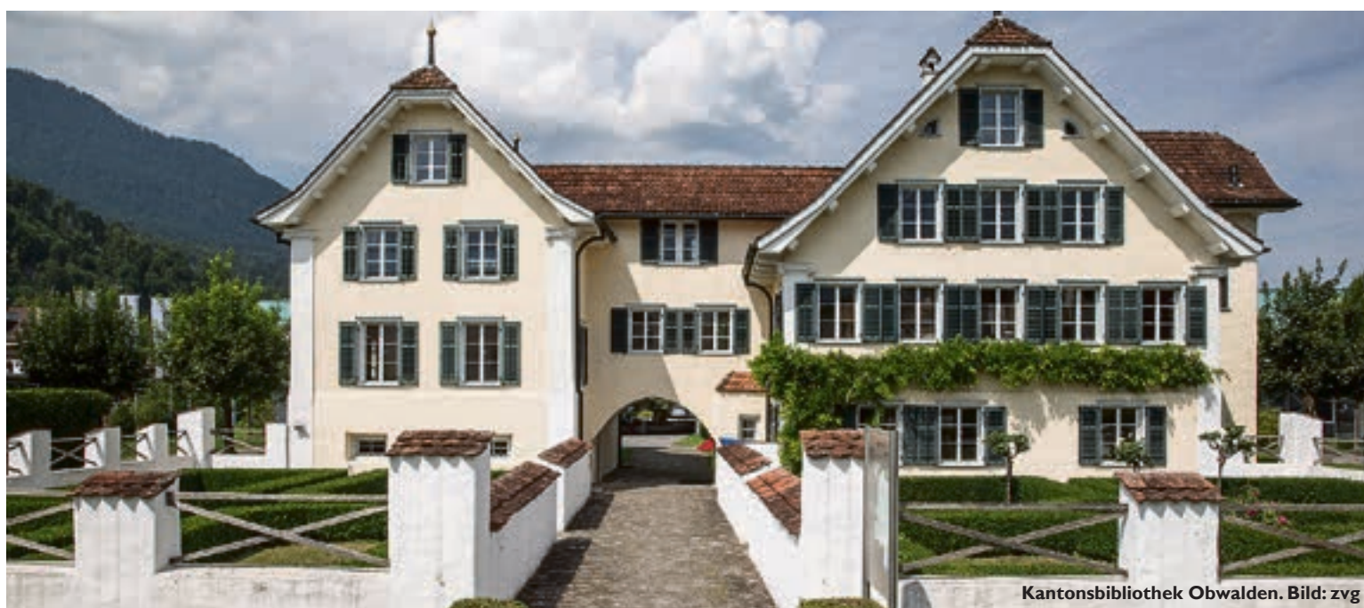
Kantonsbibliothek Obwalden.

Die Kantonsbibliothek Obwalden feiert im kommenden Jahr ihr 125-Jahre-Jubiläum.