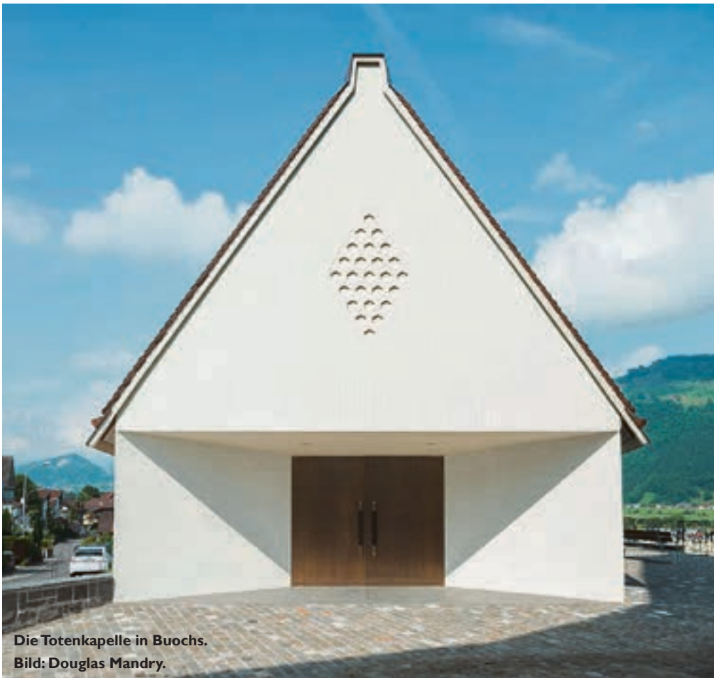
Die Totenkapelle in Buochs.

Das von Andrea Wiegelmann herausgegebene Buch zur Totenkapelle Buochs überzeugt auf mehreren Ebenen und landet auf der Shortlist des Architectural Book Award.