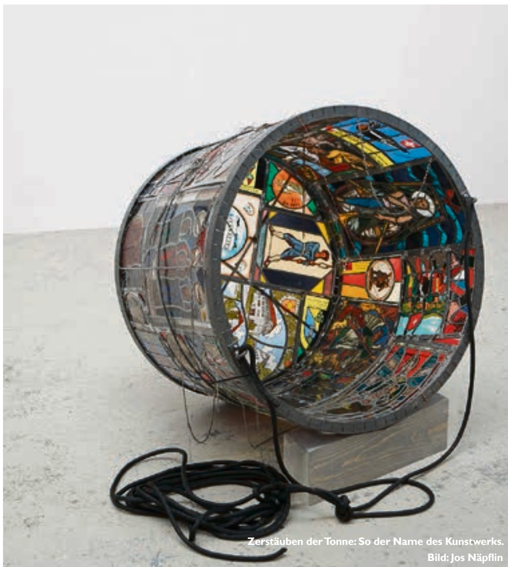
Zerstäuben der Tonne: So der Name des Kunstwerks.