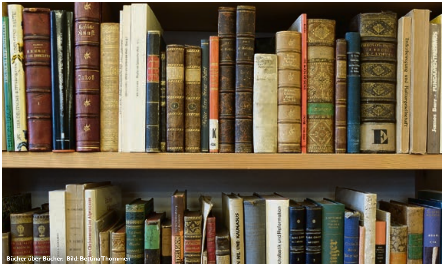
Bücher über Bücher.

schaften. Die restlichen 20 Prozent sind dem Bereich Varia zuzurechnen. Die genaue Zahl der Bücher weiss nicht einmal der Antiquar selbst; und überhaupt, diese verändert sich auch laufend. Denn die Grundaufgabe eines Antiquariats ist nicht das Verwahren, sondern der Ankauf und Verkauf von alten Büchern. Woher kommen denn all die Bücher, die ins Antiquariat aufgenommen werden? «Grössere Büchermengen gelangen vor allem aus Bibliotheksaufösungen oder privaten Nachlässen zu uns», erklärt Becker. «Dazu kommen Ankäufe an Auktionen, oft auch auf spezifischen Kundenwunsch.» Diese Kundschaft hat sich über die letzten Jahre verändert. «Der klassische Sammler oder Universalgelehrte existiert immer weniger», sagt Becker. Heute kämen seine Kunden eher aus dem institutionellen Bereich, so zählten etwa Universitätsbibliotheken oder Archive dazu. Diese