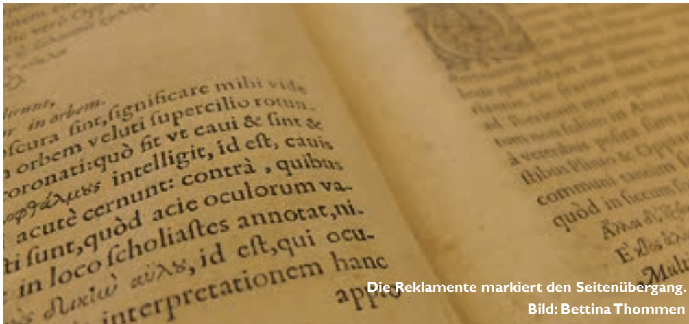
Die Reklamente markiert den Seitenübergang.