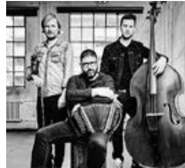
Konzertprogramm in Lungern www.prolauwis.ch